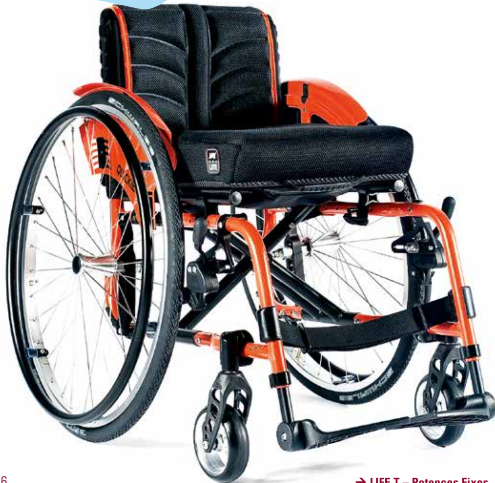
→ LIFE T – Potences Fixes