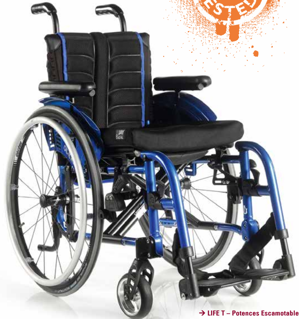
→ LIFE T – Potences Escamotables